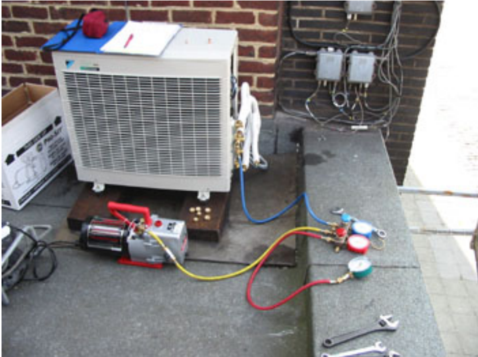
RAPPEL DE MONTAGE MANOMETRE // VIDE // ET DE MISE SOUS PRESSION