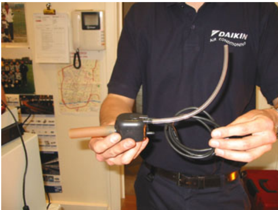
PREPARATION FLOTTEUR A RACCORDER SUR POMPE ELECTRIQUE EVACUATION EAU VERS EXTERIEUR

PLACEMENT TUYAUX DU FLOTTEUR CONVENABLEMENT